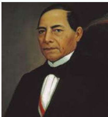
Lic. Benito Juárez García

El Lic. Benito Juárez García, es llamado para ocupar el cargo de magistrado interino de la Corte de Justicia de Oaxaca.