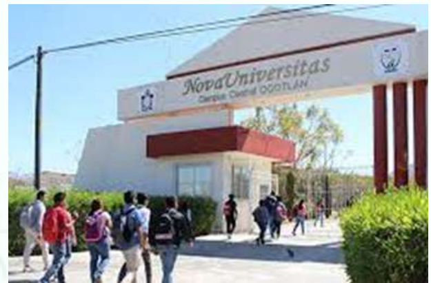
Novauniversitas campus central Ocotlán

estado contará con el Sistema Universitario más completo de la República Mexicana.